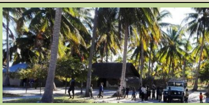
Lalane dorp is baie geraak deur die aanvalle.

Die gebied waarheen ons beplan om te skuif, Olumbe , was die afgelope weke die skuilplek van die 'rebellé' wat gevlug het. Drie weke gelede is daar groepe soldate, wat vanuit Tanzanië gekom het, gevang. Op die oomblik is die situasie kalm, en hoop ons dat hiedie aanvallers 'n nekslag toegedien is..