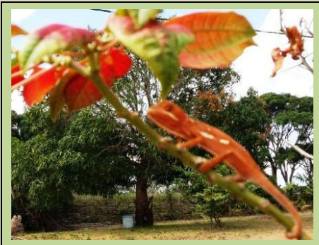
Ons reflekteer God se heilikeheid as ons, soos Moses, in Sy teenwoordigheid verkeer.

In die laaste twee dissiplineskaplesse het ons oor praktiese beginsels vir 'heiligmaking' (geestelike groei) gesels. My gunstelig teksvers sê ons weerspieël die heerlijkheid vd Here; en word daarom al meer verander om aan die beeld van Christus gelyk te word. En so neem God se heerlijkheid wat uit ons straal steeds toe. Ek besef opnuut dat geestelike groei nie oor my beter lewe gaan nie, maar oor God wat die sentrale plek meer en meer in my wese inneem. Ons leef om Hom te verheerlik!